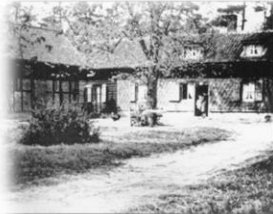
Das ehemalige Forsthaus um das Jahr 1900. Das Forsthausköpfschilde (links) ist nicht erhalten.

Kürzlich war ich in Funktion des Wanderwegewartes auf Kontrollgang auf unserem Ardbinna-Wanderweg beim Reinigen des Schildes 23: „Forsthaus Althubertushöhe“.